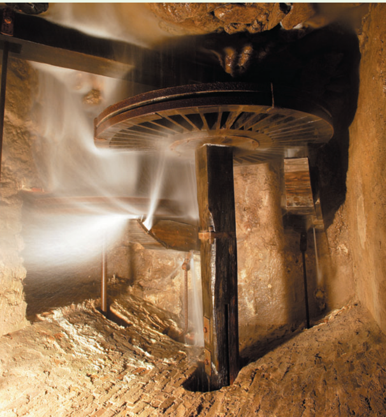
Moli de les Tres Eres

Plaça de l'Ajuntament, 4 43850 CAMBRILS TEL. 977 794 579