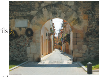
Portal del Carrer Major